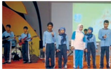
Auftritt der Schulband der YPAB Blindenschule in Surabaya

Die Band der YPAB Blindenschule in Surabaya ist wieder bei verschiedenen Veranstaltungen aufgetreten. Am 13. Juni 2011 war ein nationales Schulband Festival in der Stadt Batu, das ca. 150 km östlich von Surabaya liegt. Obwohl die Fahrt sehr anstrengend für die Schülerinnen und Schüler war, waren sie doch glücklich, dass sie auftreten durften. Das Publikum war begeistert und die Tatsache, dass alle Kinder sehbehindert bzw. blind sind, imponierte den Zuhörern noch mehr. Die Schülerinnen und Schüler unserer Musikgruppe bekamen sehr viel Applaus.